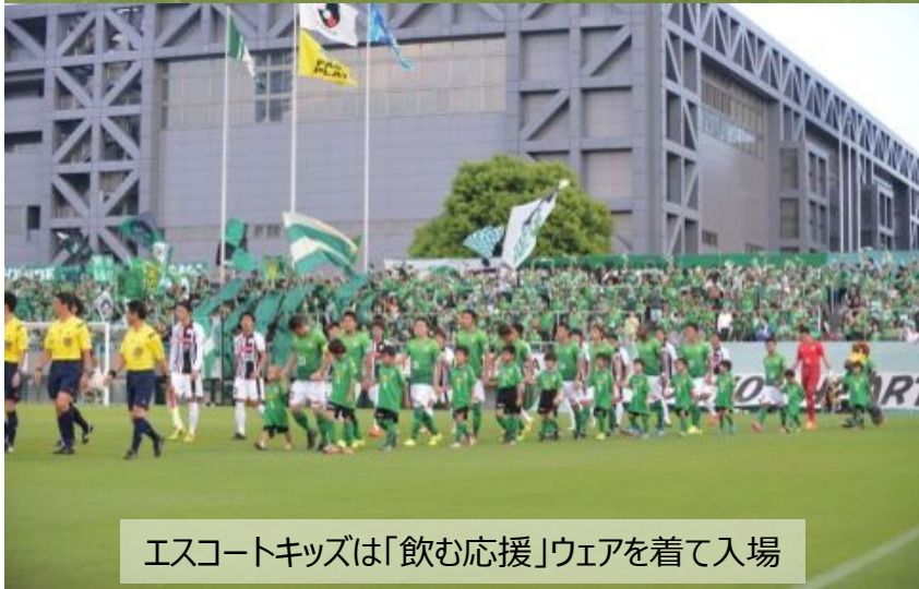
エスコートキッズは「飲む応援」ウェアを着て入場